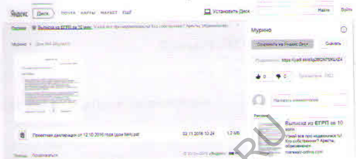
Изображение интернет страницы по адресу https://yadi.sk/d/ig2BQN7SKLkZ4/%D0%94%D0%BE%D0%BC%20%E2%84%964%20(%D0%9C%D1%83%D1%80%D0%B8%D0%BD%D0%BE)